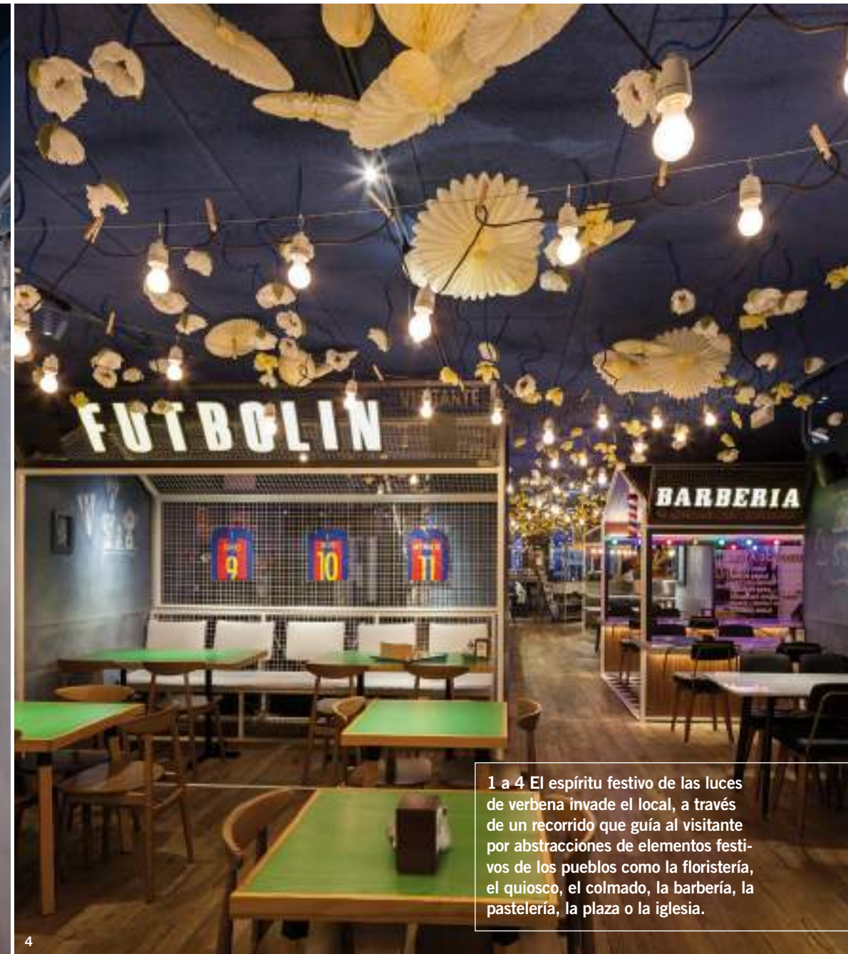
1 a 4 El espíritu festivo de las luces de verbena invade el local, a través de un recorrido que guía al visitante por abstracciones de elementos festivos de los pueblos como la floristería, el quiosco, el colmado, la barbería, la pastelería, la plaza o la iglesia.